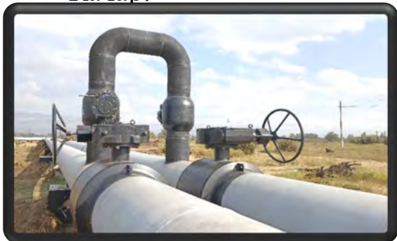
Протяженность магистральных тепловых сетей – 36,6 км.